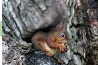
Mammifères hors Chiroptères

Science participative grand public mobilisable