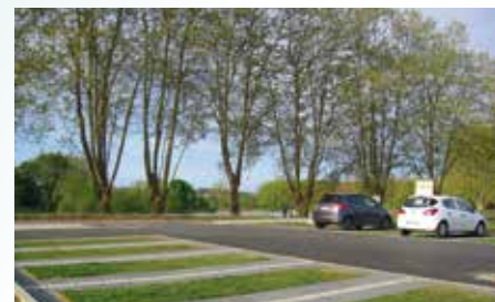
Parking lac côté Zazarta

Les essais de ce dispositif, en conditions réelles, nous ont permis de valider les débits et la pression d'arrosage, ce qui